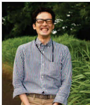
慶應義塾大学 インキュベーションマネージャー