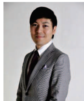
株式会社コアストリーム 代表取締役