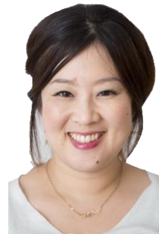
福岡県よろず支援拠点コーディネーター

福岡のテレビ制作会社で音楽番組、情報番組、通販番組のディレクターとして活動し、数々の店を取材するうちに飲食の魅力に惹かれ、さらに多くの店と出会うべく、出版社に転職。グルメ本、フリーマガジンの創刊、広告の営業制作に携わる。気付けば年間1000店舗の飲食店を下見&取材！現在は自分の料理教室を運営しつつ、飲食店のフードプロデュース、スタイリスト（撮影用料理）、雑誌へのレシピ提供、時々テレビの料理コーナーにも出演しています！