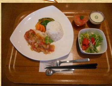
【前回のトライアルオープン】