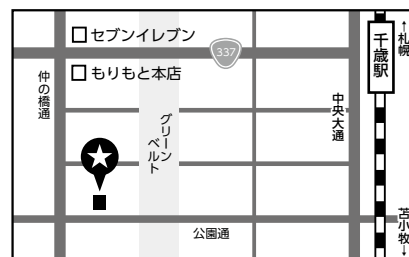
中心街コミュニティセンター地図