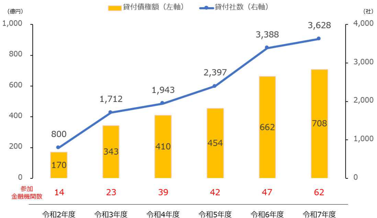
(参考2) 過年度組成規模の推移