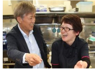
譲受側（写真左） 譲渡側（写真右）

石川県金沢市と珠洲市で介護事業を営む事業者。石川県内で7施設を経営。珠洲市の事業所では譲渡側から弁当を仕入れていた。