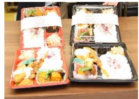
能登の特産を使用した人気の弁当