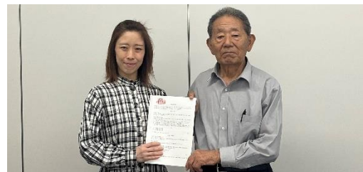
譲受側（写真左）と譲渡側（写真右）

【譲渡側】 洋服直しの専門店を経営する事業者。従業員の雇用継続のため第三者承継を検討。令和6年2月、東京開催のイベントに登壇