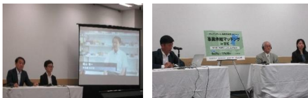
譲渡希望者の事業紹介