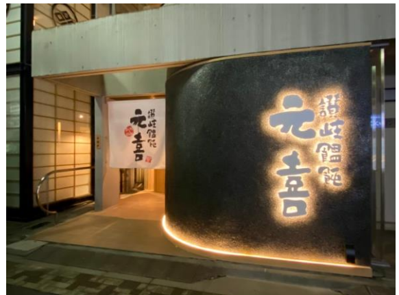
<事業承継後の店舗外観>