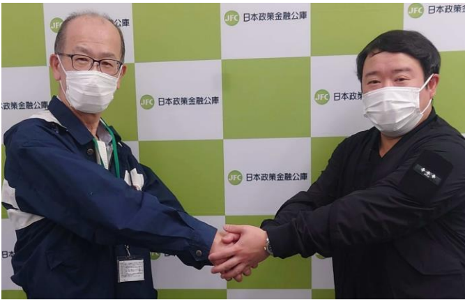
<譲渡契約締結式当日の様子>