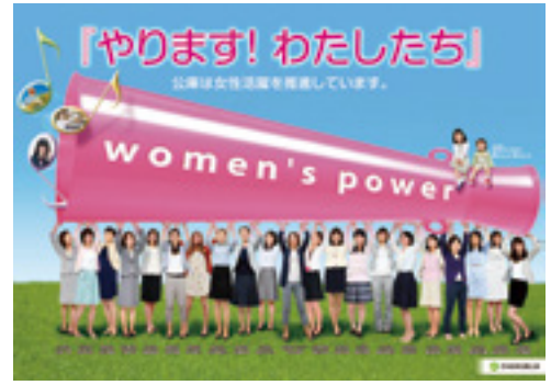
女性活躍推進ポスター

全国10ブロックの「女性活躍推進地域委員会」(札幌、仙台、さいたま、東京、横浜、名古屋、大阪、広島、高松、福岡の各支店に設置)を中心に、全152支店で多様な視点や人材を活かした活動を計画・実施しています。平成25年度からは全国に10名の「女性活躍推進専任者」を配置し、ブロック内支店が連携しやすい体制を構築し、当活動の定着を図るとともに、外部機関との積極的連携に向けた取組みを展開しています。