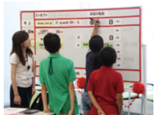
平成25年度 家族の職場参観「ジュニアアカデミー」の様子

加えて、平成25年度は職員のニーズを踏まえ、「出産・育児体験教室」「介護体験教室」を開催し、仕事と家庭を両立する職員への理解促進を図っています。