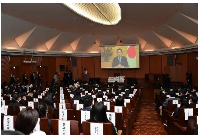
【 会場の様子 】

日本公庫は、起業を増やし、活力あふれる日本を創っていくために、これからも次世代を担う若者の創業マインド向上に取り組んでいきます。