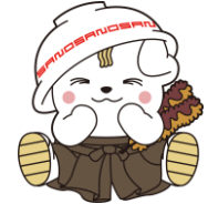
佐野ブランドキャラクター さのまる ©佐野市