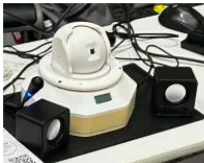
<デバイスの試作品>