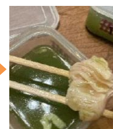
鶏肉や豚肉等を液につけ反応を確認する