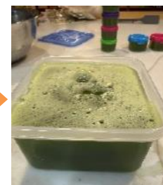
ブロメライン液を抽出する