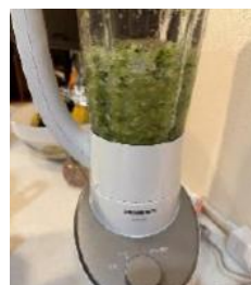
パイナップルをミキサーで刻む