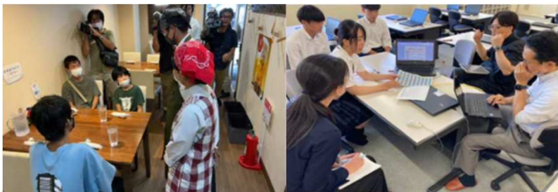
＜伊東市にて試験実施中の様子＞