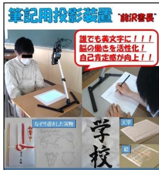
筆記用投影装置「前沢書長」