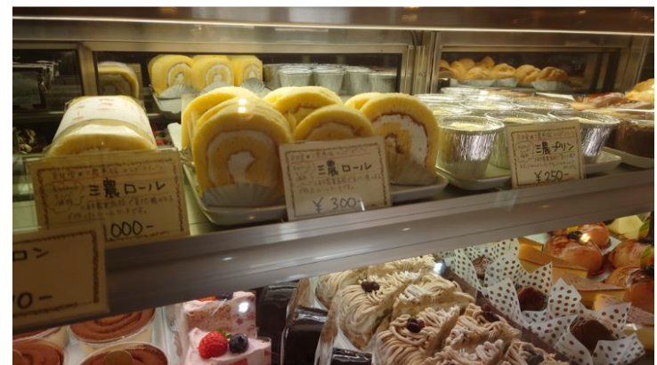
地元洋菓子店に製造委託した機能性鶏卵を使用したロールケーキ