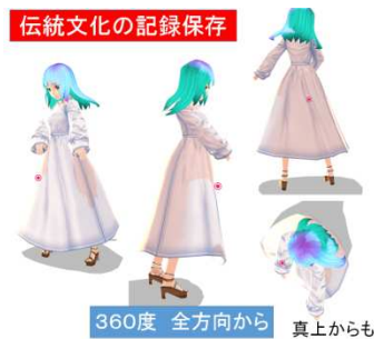
360度 全方向から 真上からも