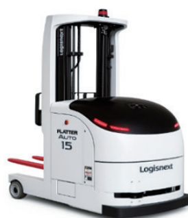
無人フォークリフト