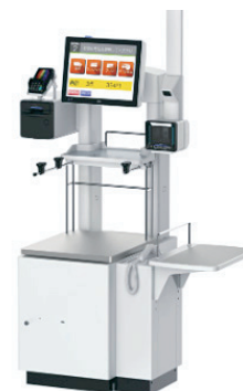
キャッシュレスセルフフレジ