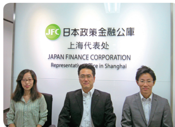
上海駐在員事務所開設メンバー

日本公庫は、中小企業の海外展開を支援するため、9月12日付けで上海駐在員事務所を開設しました。