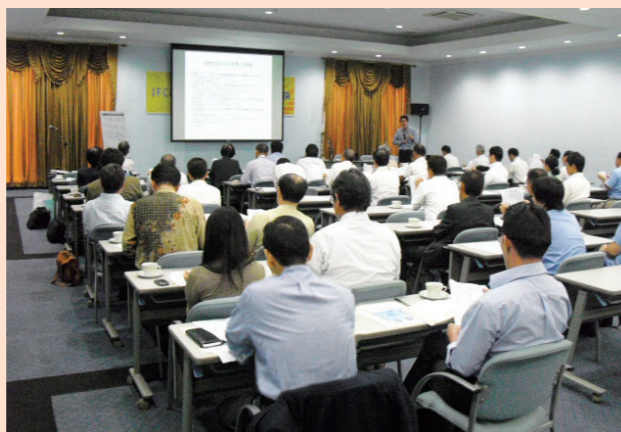
ハウズインターナショナルリミテッドの湯浅代表による講演会の様子