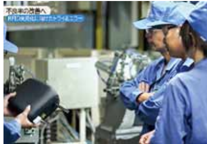
不良率改善に向けて、 試行錯誤で挑戦を重ねるRFID活用事例 (松本工業 (株))