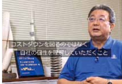
進化をもたらすバネの力「東海バネ工業」の未来図 (東海バネ工業 (株))