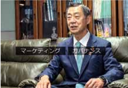
衛生・環境・健康「サラヤ」の企業哲学 (サラヤ (株))