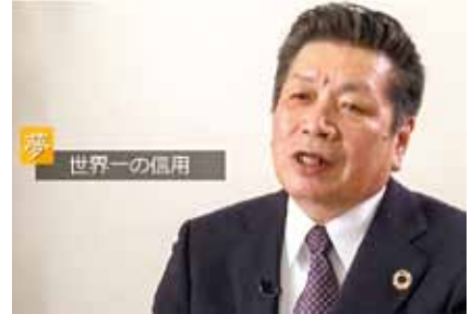
“世界一”を目指して「富田製作所」の挑戦 (株) 富田製作所