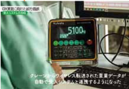
現場主導のシステム開発で受入処理の 効率化に取り組んだ事例 (北海道ワイン (株))