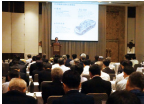
タイ取引先現地法人交流会の様子

2017年10月5日、タイ・バンコクにおいて「タイ取引先現地法人交流会」を開催しました。当日はタイへ進出している公庫取引先現地法人90名の皆さまにご参加いただき盛況となりました。