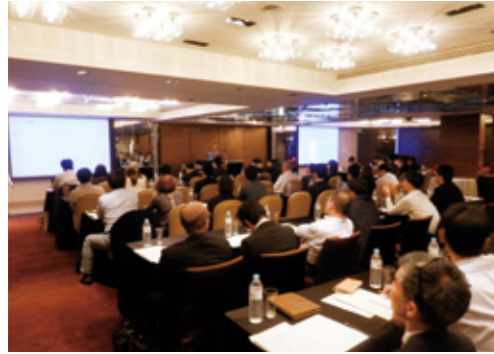
台湾進出日系企業セミナーの様子