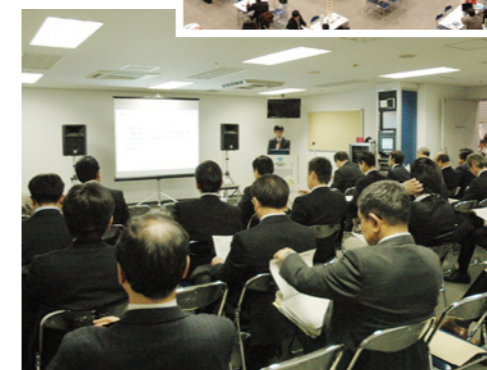
海外展開セミナーの様子

今回の商談会の特徴は、(1) 自社の商品を見せながら商談をしたいという参加企業の声を反映し、商談スペースを広くとったこと（会場スペースは前回比1.5倍）、(2) 前回と同様、日本貿易振興機構（JETRO）、中小企業基盤整備機構および日中投資促進機構の3機関の相談ブースを設けるとともに、今回は新たにJETROとの連携により、①海外展開セミナーを開催、②韓国、シンガポール、ベトナム、インドから、電子・電機、機械関連の海外バイヤーを招聘し、商談機会を提供、③輸出実務経験者による個別相談機会を提供したことです。