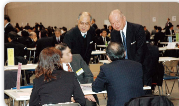
被災地から参加した企業の方々に声をかける安居総裁（右）

日本公庫は、平成24年2月27日、パシフィコ横浜にて、「全国ビジネス商談会」を開催しました。前回に引き続き、協賛機関である沖縄振興開発金融公庫のお取引先も参加し、全国から708社、1,649名の方々にご来場いただきました。