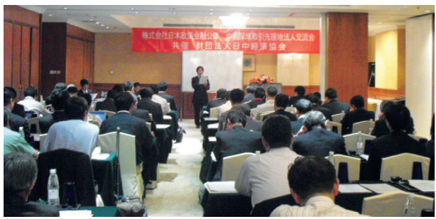
深圳の講演会の様子

大連 開催日：平成23年6月2日 開催地：中国・大連 参加者：大連市周辺進出企業 約40社 内容：「日系企業の中国国内市場開拓に伴う法的リスクとその対策」をテーマにした、現地弁護士による講演会及び参加企業による企業PR