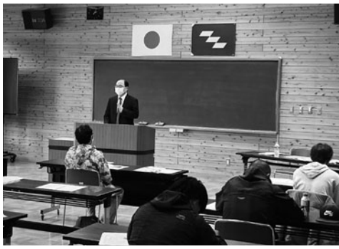
講義の様子。研修生は宮崎県内の事業者への就職をめざしています