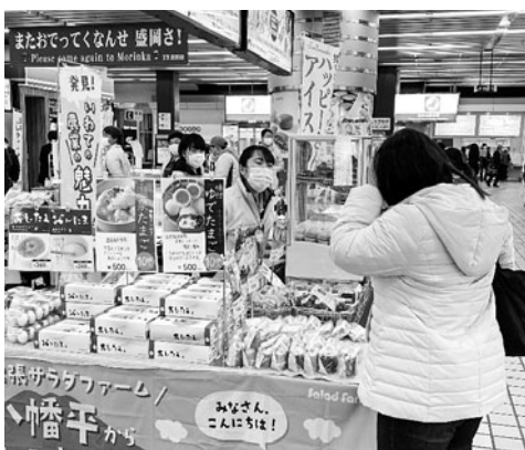
参加者同士、横のつながりもできました