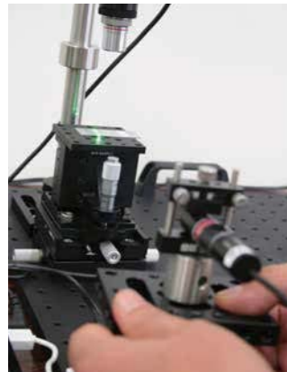
手づくりのレーザーの照射型顕微鏡。