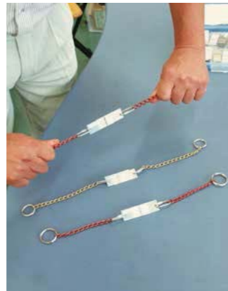
PMS処理で接合した金属とプラスチック。

「無限の可能性の中から 一度の挑戦で生まれた新技術。 この奇跡のような成功を 世界の標準技術へと導きたい」