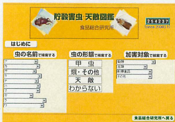
貯穀害虫・天敵図鑑