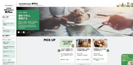
「日本公庫 事業者Support Plus」