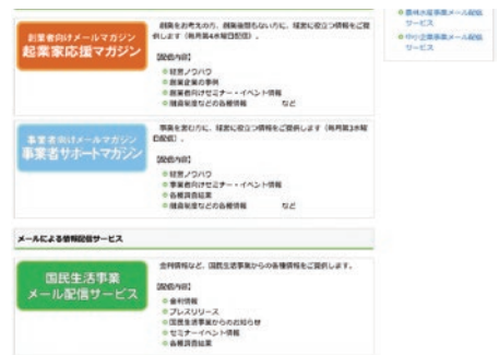
ホームページの登録画面入口