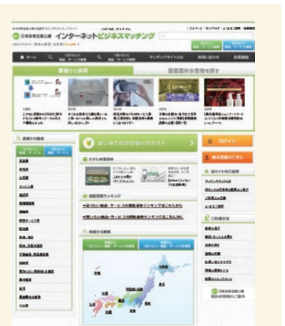
インターネットビジネスマッチング