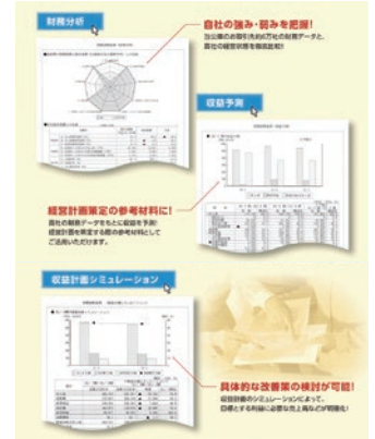
財務診断サービス

収益計画シミュレーションによって、目標とする利益に必要な売上高などを明確化します。