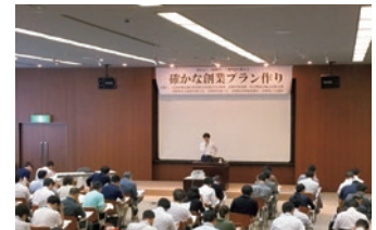
商工会議所と共催した創業支援セミナー

創業支援セミナーを共催するなど、商工会議所・商工会と連携して地域の創業支援活動に積極的に取り組んでいます。セミナーでは創業を考えている方を対象にビジネスプランの作成方法や資金調達の方法、当事業の融資制度などについてわかりやすく説明しています。セミナー受講後、当事業の融資を利用して、創業する方も数多くおられます。