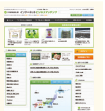
インターネットビジネスマッチング