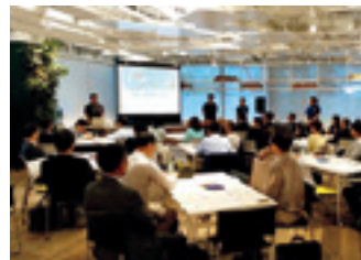
東京都で開催した「事業創造TOKYO LEAGUE」

また、税理士や経営コンサルタントのほか、当事業を利用して創業された方を講師に迎え、ビジネスプランの作成方法や創業時の留意点などを語っていただくなど、経営に役立つ幅広い情報を提供しています。