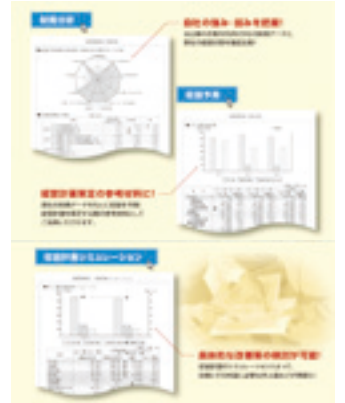
財務診断サービス

お客さまを取り巻く状況(外部環境)と企業の強み・弱み(内部環境)を分析する「SWOT分析」を活用し、経営に役立つアドバイスを行っています。