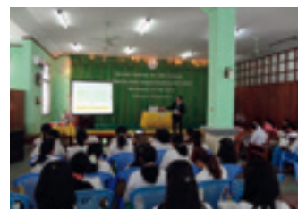
ミャンマーでのセミナーの様子(ヤンゴン)