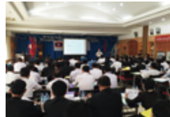
ラオスでのセミナーの様子(ビエンチャン)

平成30年6月からは、MEBの融資審査能力の更なる向上を目指し、第2期プロジェクトを開始しました。MEBが新設した中小企業向け融資制度が軌道に乗るように、融資審査フォーマットの改定等を支援しています。