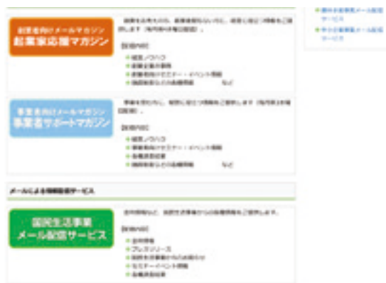
ホームページの登録画面入口

※金利の改定やセミナー情報をメールでお知らせする「国民生活事業メール配信サービス」も提供しています。