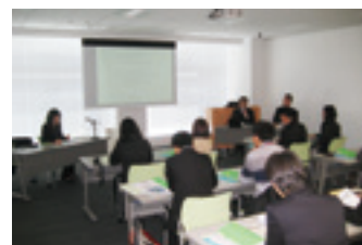
視察団に対する講義風景

開発途上国をはじめとして、日本の経験を学ぼうと毎年数多くの国々から視察団が来日しています。当事業では、JICAなどが主催する研修事業の一環として視察に来られる海外の政府関係機関の方々に対し、当事業の歴史、業務概要、融資制度や各種取組みなどに関する講義を実施しています。