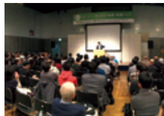
福岡市で開催した「九州・山口・沖縄 移住& 起業・就農フェア」