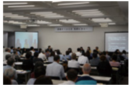
生きがいしごとサポートセンターと共催した「ひょうごコミュニティビジネスフォーラム」