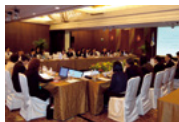
第10回APEC MOU年次会合(シンガポール)

(注)アジア太平洋経済協力会議(APEC)域内の中小企業金融に携わる金融機関間の協力に関する覚書