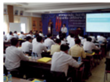
ラオス現地セミナーでの講義(ビエンチャン)

これまで、同様のプロジェクトをベトナム、マレーシアで実施し、ラオスが3カ国目となります。