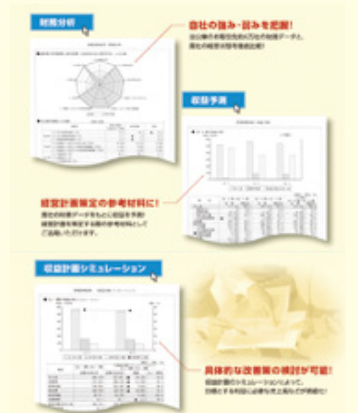
財務診断サービス

お客さまを取り巻く状況(外部環境)と企業の強み・弱み(内部環境)を分析する「SWOT分析」を活用し、経営に役立つアドバイスをを行っています。