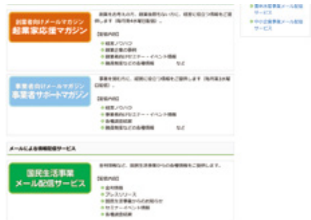
ホームページの登録画面入口

当事業では、創業をお考えの方や事業を営む皆さま向けのメールマガジンを配信しています。登録は無料で、ホームページから登録いただけます。