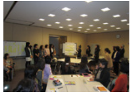
県・教育委員会と連携した「女性起業家支援セミナー」

また、税理士や経営コンサルタントのほか、当事業を利用して創業された企業の方を講師に迎え、ビジネスプランの作成方法や創業時の留意点等を語っていただくなど、経営に役立つ幅広い情報を提供しています。