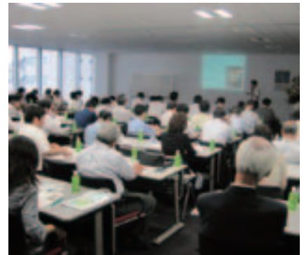
金融機関と共催した「経営力アップセミナー」