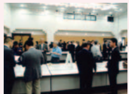
200名のお客さまが参加したマッチング交流会

お客さまの経営課題の解決のため、各事業等のネットワークを活用して専門ノウハウを有する外部機関などを紹介しています。