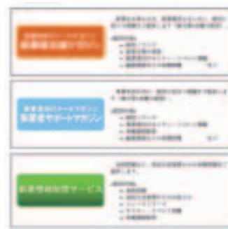
ホームページの登録画面入口

※また、金利の改定等、ホームページが更新されたことをメールでお知らせする「新着情報配信サービス」も配信しています。