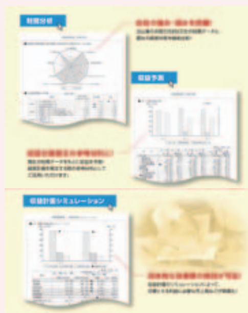
財務診断サービス

お客さまを取り巻く状況（外部環境）と企業の強み・弱み（内部環境）を分析する「SWOT分析」を活用し、経営に役立つアドバイスを行っています。