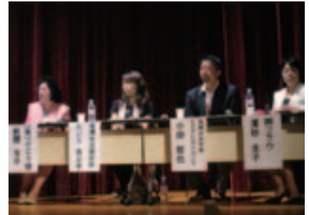
ソーシャルビジネス・コミュニティビジネスフォーラム