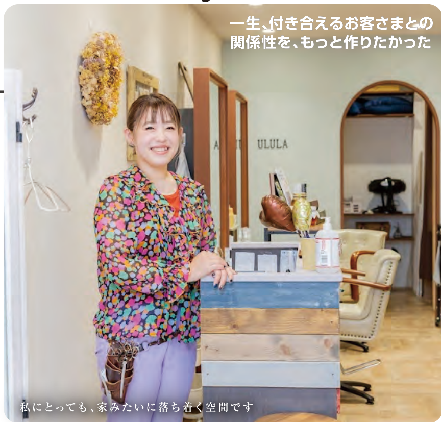
私にとっても、家みたいに落ち着く空間です