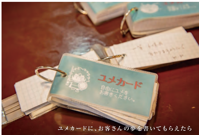
ユメカードに、お客さんの夢を書いてもらえたら

例えば、街なかでは被り物をしない人たちも、ディズニーランドやユニバでは平気でみんな被りますよね。うちのお店は「ここに来たら夢を語っちゃおうかな」と思えるおもしろおかしな空間にしたいんです。