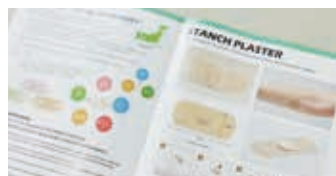
展示会では パンフレットを 見せながら説明

「目標としては海外のみで売上10億円。 日本だけで販売するのと比べると、海外マー ケットはその何十倍も大きい。この可能性の 大きさはやっぱり魅力です。まずは輸出で取 り扱う商品数を拡大していくことが必須。続 けていくことで、例えば日本から遠く離れた国 で、その国の言葉で、「リバテープあるよ!」と いう会話が飛び交う風景をつくることができ るかもしれない。そんなビジョンとともに取り 組んでいきます」