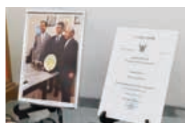
2019年2月にタイ企業と合弁で現地法人 (GOSHU (Thailand) Co., Ltd.) を設立

多く開催されており、ヨーロッパ進出の足掛かりとして、まずはイタリアへの進出に取り組んでいる。ただし、EU諸国は規制が厳しく、製品の改良などに伴う資金面の負担が大きいため、補助額が大きく補助率も高い中小企業庁のJAPANブランド育成支援等事業に応募。2020年に同事業に採択され、補助金を活用して、試作品の製造や展示会への出展を実施。その中で世界最大級の化粧品総合展示会「コスモプロフ・ボローニャ」において、世界的なビューティートレンドウォッチャーが選出する2023年度コスモトレンドの最終候補に、同社の「ALTITUDE3000 ナチュラルスパモイスチャー」が選出された。