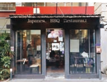
タイの「肉匠」は 連日焼肉ファンでにぎわう