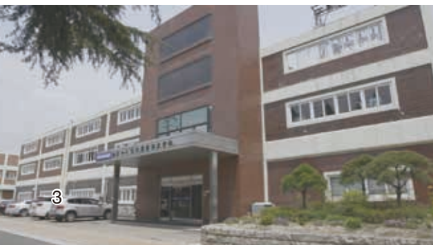
韓国中川電化産業本社 従業員は100人を超える

早くから海外展開に取り組み、現地での情報収集や課題解決などは基本的に自社で対応してきたが、 ベトナムでの課題解決にあたっては中小企業基盤整備機構(中小機構)の活用 を考えている。同社の担当者が、 日本公庫を通じ、中小機構にベトナムにおける部品などの調達候補先や新たな販売候補先の情報収集などについて相談。