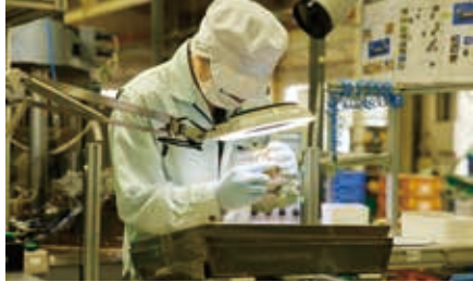
(上)洗濯乾燥機のファンモータなど多種多様な部品を生産 (下)高品質な機能部品の生産を支えるのは社員の技術