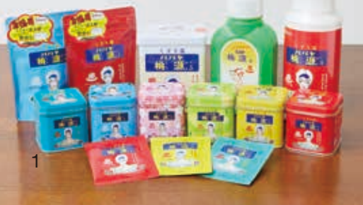
パパイヤ酵素配合の入浴剤 「パパイヤ桃源」は人気商品

タイに続く輸出先として注目しているのが大きな市場を抱えるヨーロッパだ。ヨーロッパの中でもイタリアは化粧品などの展示会が