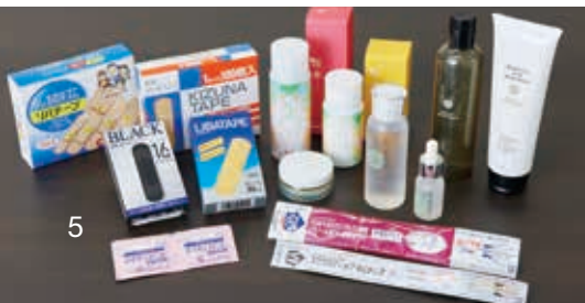
絆創膏から化粧品まで 肌を守る製品をラインアップ

「基本的に当社は、取引の際は全額前金を条件にしています。ただお客様によってはその条件がネックになって商談が進まない場合も。そんなときは NEXIを活用することで、輸出不能や代金回収不能といった“もしも”のトラブルを回避するようにしています 」(濱崎氏)