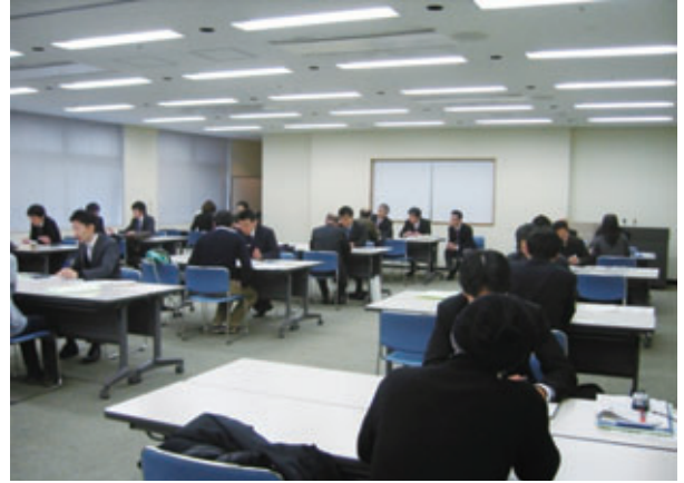
▲「創業支援セミナー」では、講演会とあわせて経営・創業についての相談会も開催します。