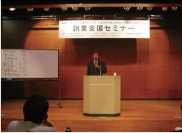
▲平成23年2月に開催した「創業支援セミナー」では、95名の方にご参加いただきました。